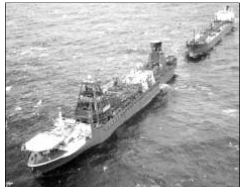
Framleiðslu- og goymsluskipið Petrojarl Foinaven og flutningskupið á Foinaven feltinum, ið eiga stóran part av lívinum í Flottaterminalinum á Orknoyggjum

Oljuterminalinur á Flotta varð tikið í nýtslu í 1977 av táverandi orkumálaráðharranum Tony Benn. Tá visti eingi, at olja fór at verða funnin vestan fyri oyggjarnar. Undir hátíðarhaldu