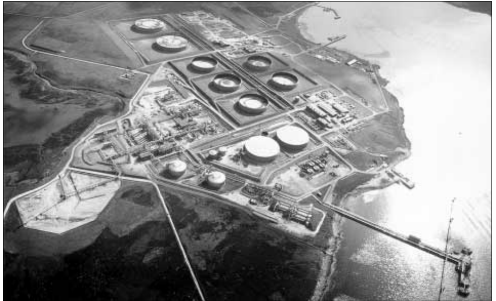
Oljuterminalinur í Flotta á Orknoyggjum hevur havt stóran týðning fyri líta oyggjasamfelagið seinastu 25 árin. Nú verður tosað um at leingja livitíðina hjá oljuhavni við 25 árum aftrat

Nú um dagarnar kundu íbúgvarnir á Orknoyggjum hátíðarhalda 25 ára dagin fyri byggingini av oljuterminalinum í Flotta. Eftir at hava gjørt fyrireikingar til at rigga av eftir eina ríka oljutíð í eina fjórðings öld er gongdin nú bráðliga vend 180 stig. Við oljufundinum vestan fyri Hetland er lív komið í aftur á Flotta, sum hvørja viku tekur ímóti stórum nøgdum