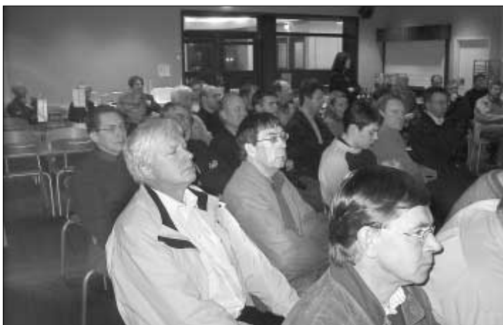
Stórur áhugi var fyri at hoyra, hvørjar treytir eru fyri brúk av oljupengum

Pengar, sum ikki verða brúktir av samlaðu 85 mill. kr. eftir at seks ára loyvið er útrunnið, fara í ein grunn, sum skal brúkast til føroysk endamál. Enn eru reglur ikki gjørdar fyri henda grunnin.